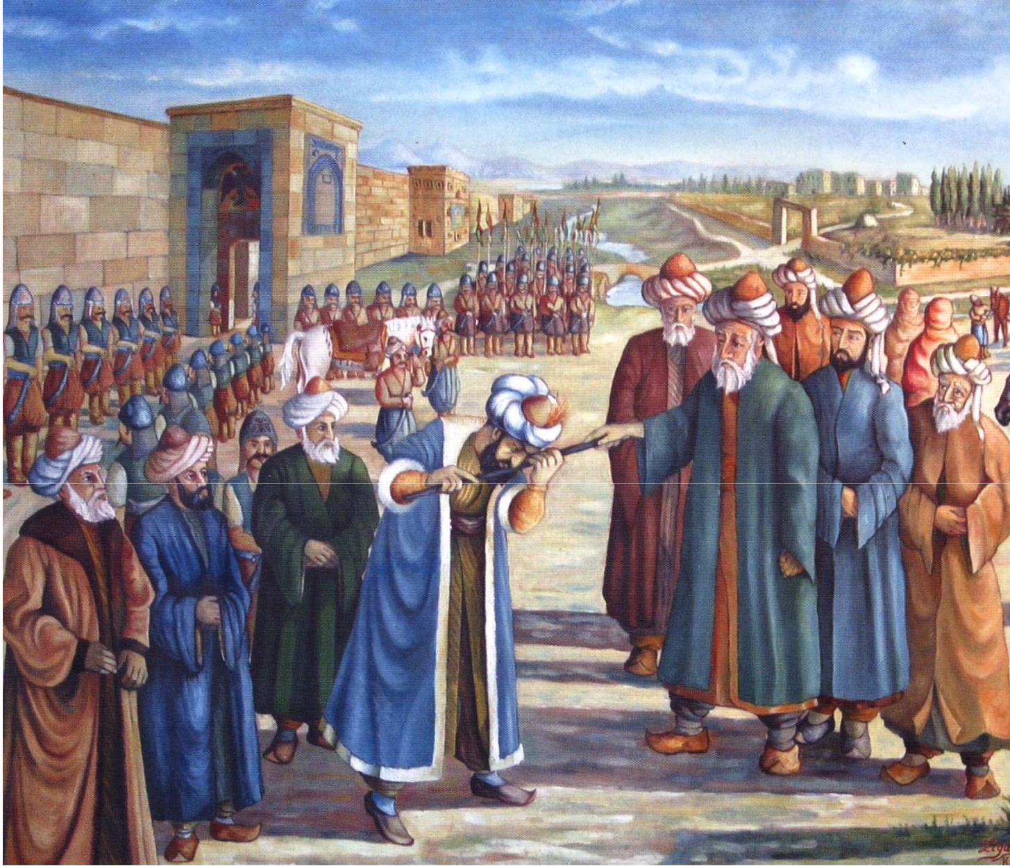
Selçuklu Sultanı Alâeddin Keykubât'ın Mevlâna'nın babasını, Konya şehrinin girişinde karşılaması (1228)