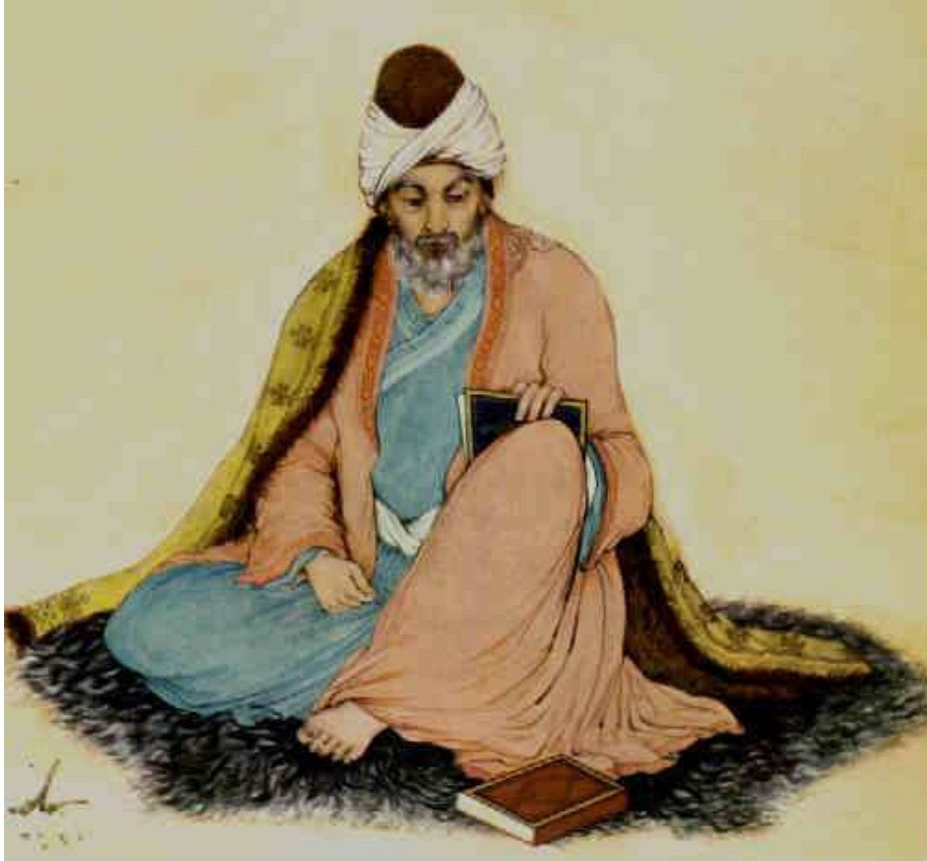
Şems-i Tebrizî (ölüm / sırra kadem basış / gayb oluş yılı 1247)