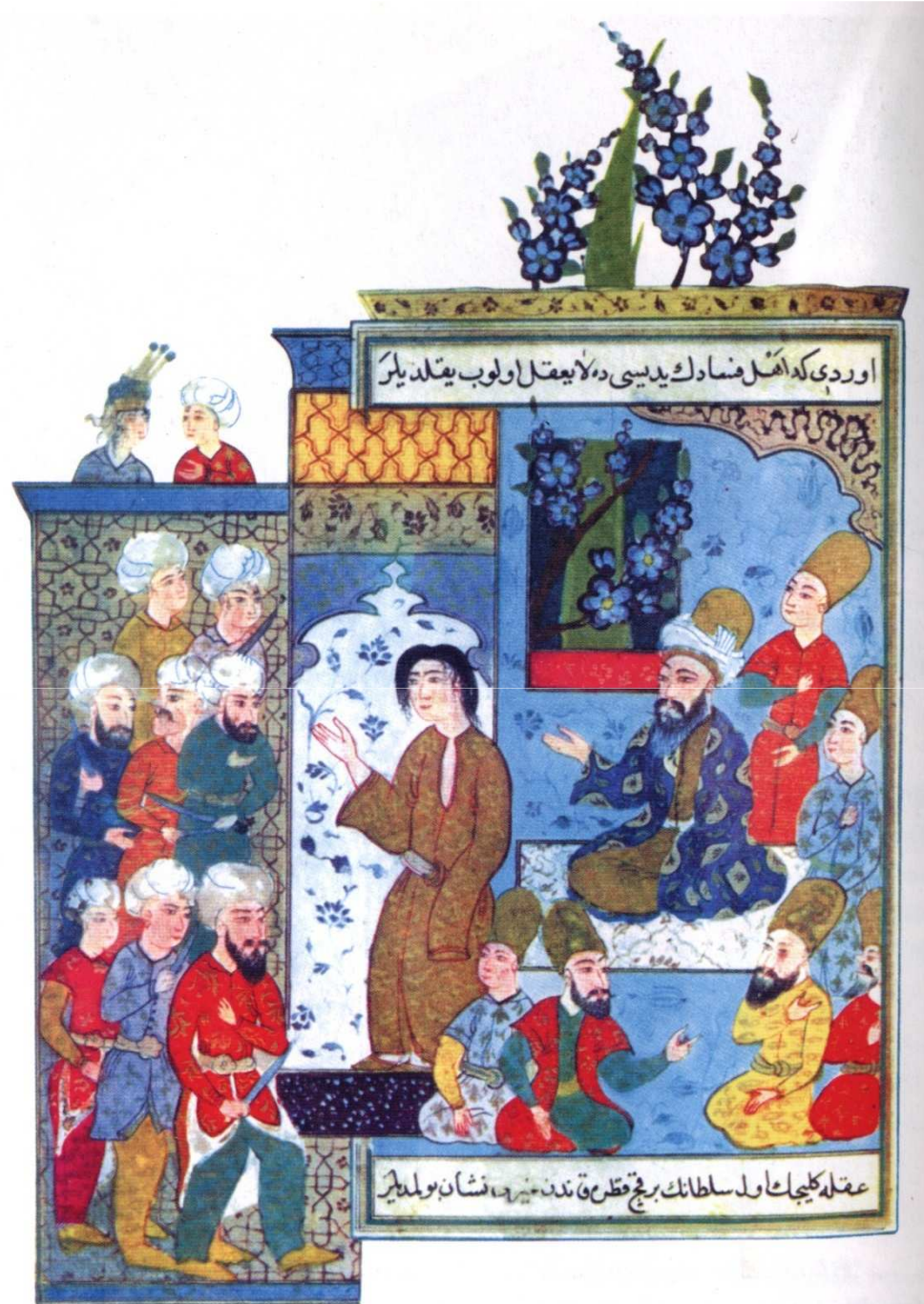
Şems-i Tebrizi'nin şehit edilmesini gösteren minyatür (Sevâkıb-ı Menâkıb. XVII yy)

Şems'in gayb olmasından sonra Hz. Mevlana yasa büründü, bulma ümidiyle bir-iki kez Şam'a gitti. Aşkla ilgili şiirler söyledi.