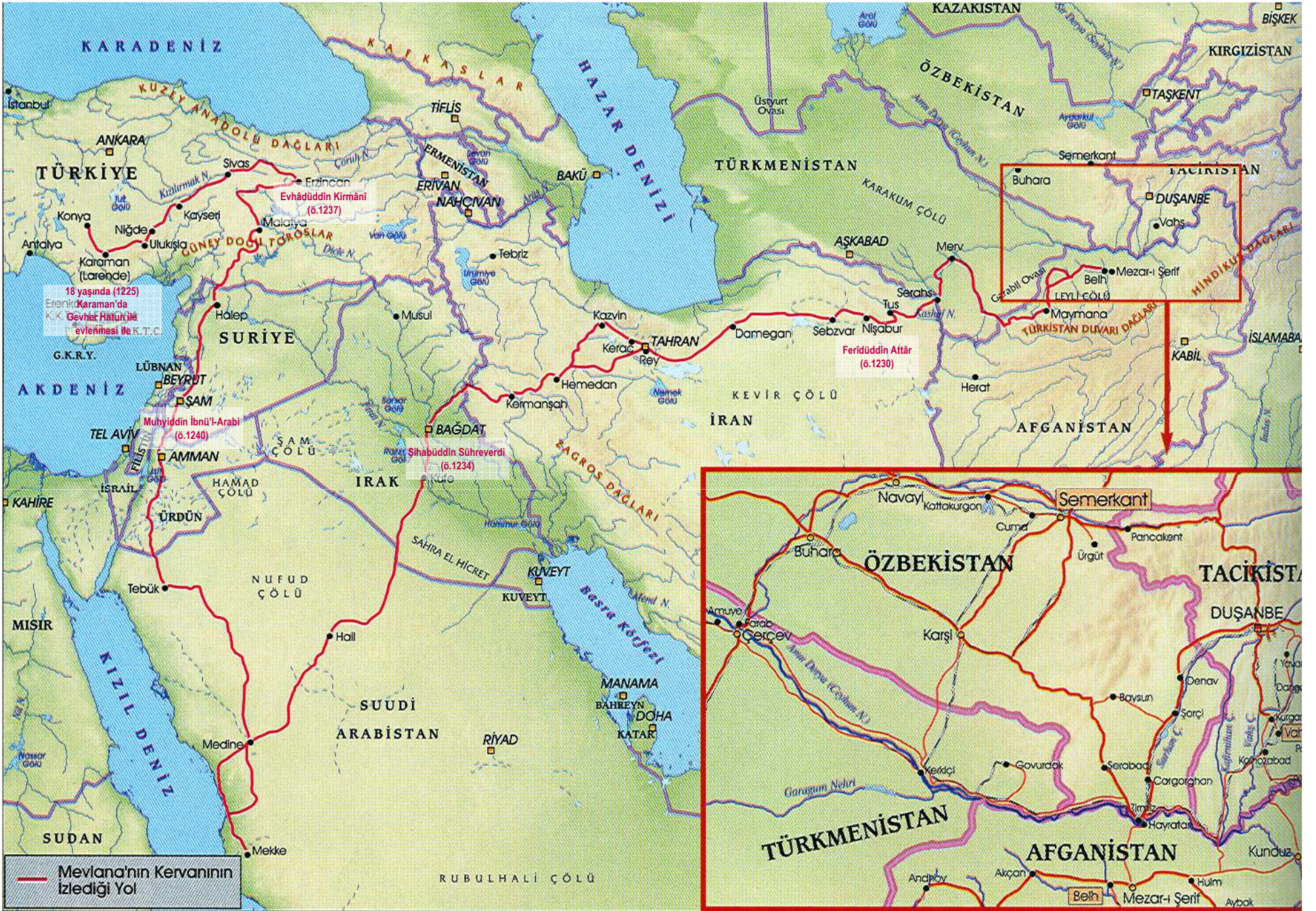
Bahaeddin Veled'in Belh Şehrinde başlayıp Konya'da sona eren göç yolu (1219-1228)