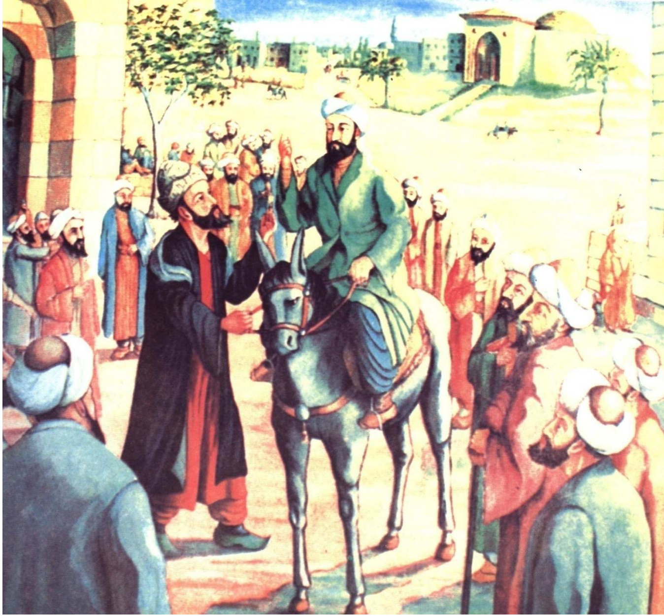
Şems-i Tebrizî ile Mevlânâ'nın karşılaşması (1244)